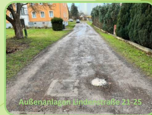
Außenanlagen Lindenstraße 21-25