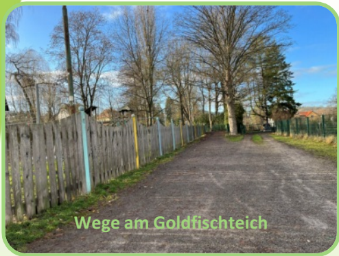
Wege am Goldfischteich